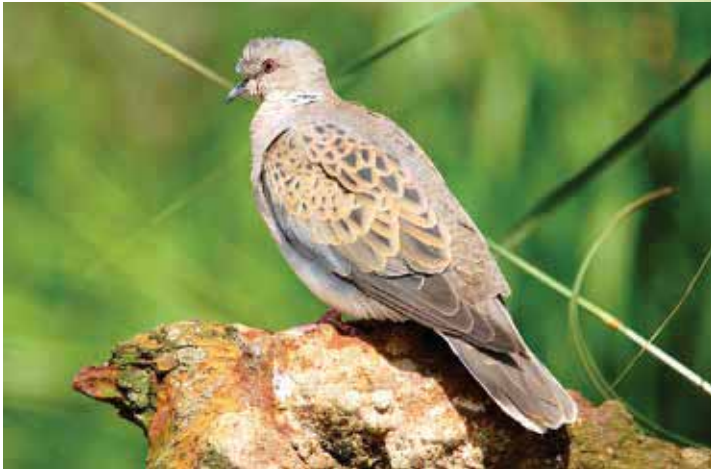
Turteltauben lieben die Gemeinschaft – nur selten trifft man sie einzeln an

gebracht: Englisch: Turtle Dove, französisch: Tourterelle, italienisch: Tortora.