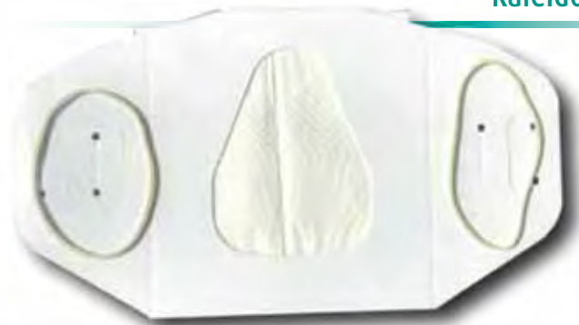
Aus der Not eine Tugend machen: Atemschutzmaske des DCM

zeigte Produkt der Meckenheimer Druckerei DCM, die seit über 10 Jahren auch den rheinkiesel druckt, ist für den einmaligen Gebrauch bestimmt, zum Beispiel beim Einkauf im Einzelhandelsgeschäft. Abgabe nur in größeren Mengen.