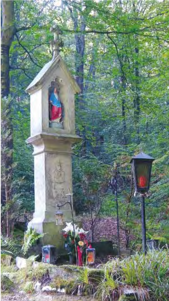
Durch die Stille des Waldes gelangt man zur Mariensäule. Viele Wanderer entzünden mit einem heimlichen Wunsch eine Kerze an der Säule