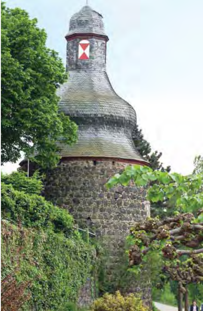
Romantisch ist der Gefängnisturm am Unkeler Rheinufer – allerdings nicht für die zeitweiligen Insassen

Verbrechen muss geahndet werden. Sie müssen den Schaden ersetzen! Vassbender hat ja dies in seiner Vernehmung vom 15. Januar 1776 angeboten.“