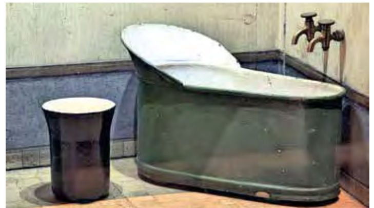
Der „Nachfolger“ der händisch zu befüllenden Zinkwanne war dieses Modell

Im Rückblick muss gesagt werden, dass Kernseife ein qualitativ hochwertiges Reinigungsmittel war und ist. Bei ihrer natürlichen Herstellung wird Kochsalz beigefügt und auf jedweden Zusatz von chemischen oder künstlichen Duftstoffen verzichtet. Deshalb findet man sie auch heute noch in jedem Biomarkt. Im Zuge der Corona-Krise erlebt die Seife eine unerwartete Konjunktur. Sauberkeit steht bei der Virenabwehr