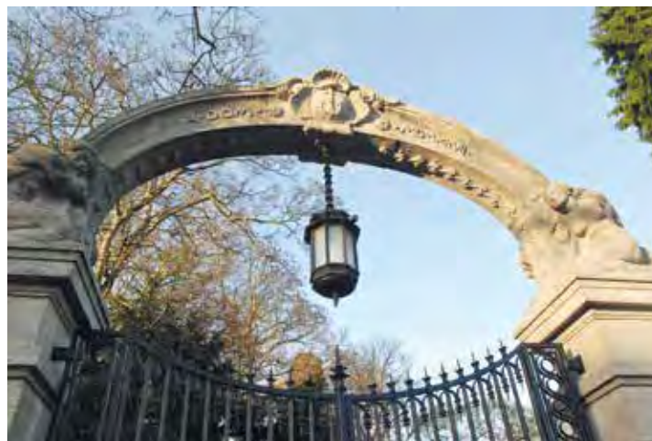
Das Eingangstor zum Gelände der ehemaligen „Villa Henkel“ in heutigen Tagen

Als ich die Überschrift Ihres Artikels „Die verschwundene Villa“ las, da klopfte mein Herz. Warum? Ich bin Jahrgang 1943 und wohnte damals mit meiner Mutter in Bad Godesberg