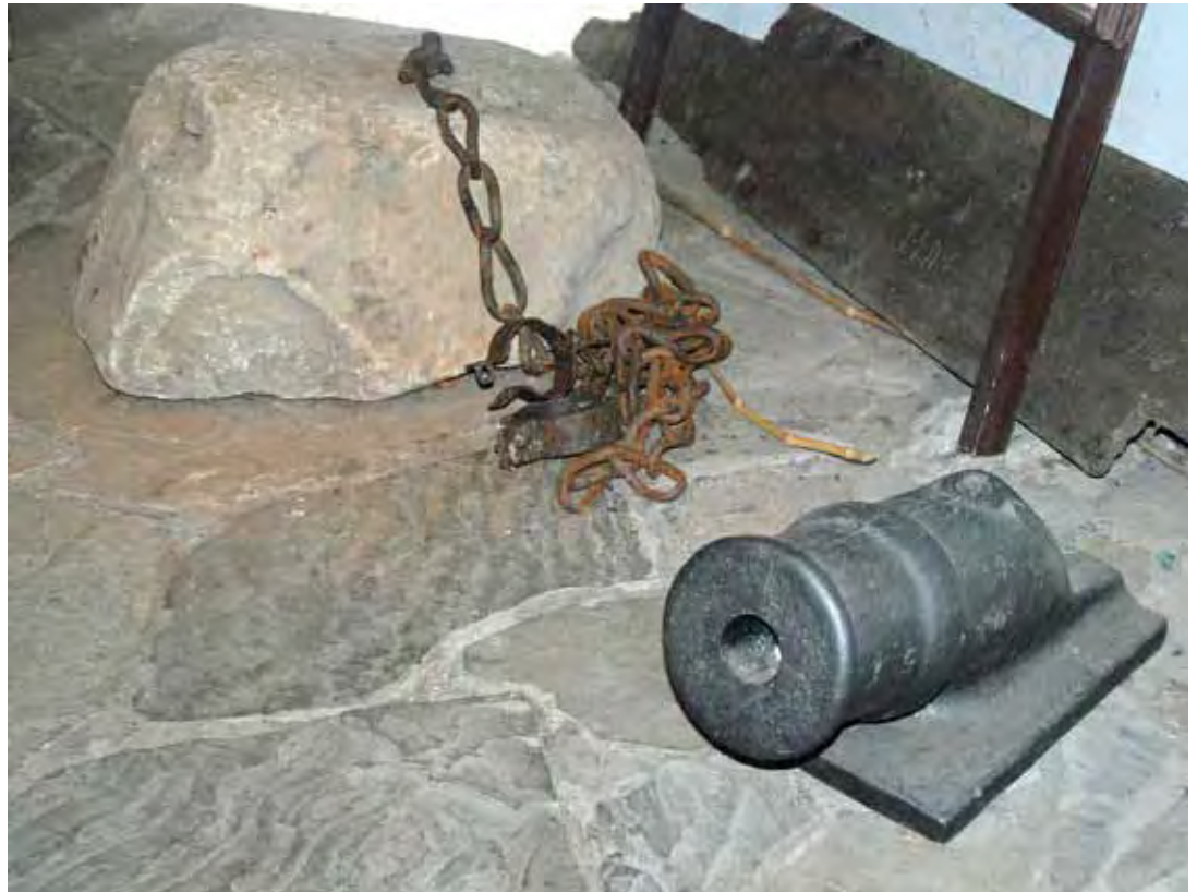
Verurteilten Straftätern drohte seinerzeit in Unkel der Kerker im Unkeler Gefängnisturm