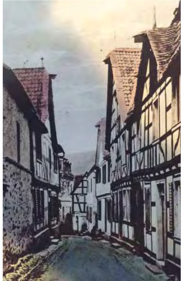
Nächtliche Untaten in Unkel

Auf den Einwand hin, dass auch alle oberen Fenster zerbrochen seien, erwiderte der Beschuldigte, dies sei seines Wissens erst 14 Tage später passiert. Bonn gab zu, dass er auf die Läden geschlagen habe, dabei seien aber keine Fenster zerbrochen. Nachdem die beiden Soldaten nach längerem Leugnen ihre Tätlichkeit zugegeben hatten, gaben sie auch schriftlich ihr Schuldbekenntnis zu Protokoll. Damit wurden sie als überführt angesehen und zu sechs Goldgulden Brüchtenstrafe sowie anteilmäßigem Ersetzen des Schadens am Judenhaus verurteilt. Damit war für die beiden