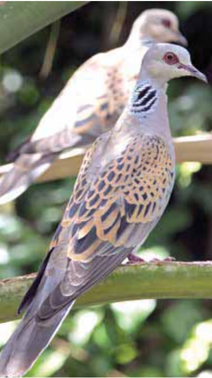
Der Lebensraum der Tiere schwindet

Vögel erlegt werden. Dabei dient die Jagd längst nicht mehr nur dem Nahrungserwerb. Die überwiegende Zahl der Abschüsse geht auf das Konto von Zeitvertreib, Spaß und Sport. Um einen Eindruck von der Intensität zu bekommen: Im EU-Staat Malta,