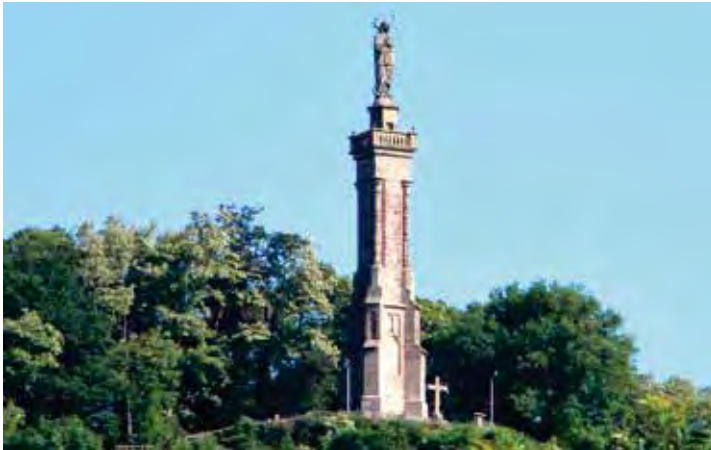
Die Mariensäule in Trier hat andere Ausmaße: Denkmal und Sockel sind zusammen 40,9 Meter hoch und stehen, weithin sichtbar, auf der linken Moseltalseite

Linzer Bürgerinnen und Bürgern auf eigene Kosten gepflegt und in Ordnung gehalten. An dieser Stelle einen großen Dank dafür! Übrigens wurde auch die Marien-Figur schon mehrmals farblich umgestaltet – letztmalig von dem Linzer Künstler Norbert Kersting, der auch vor Ort die vorhandenen Schäden verbesserte.