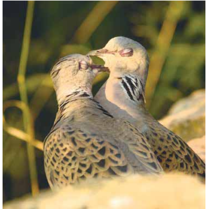
Turteltauben gelten inzwischen europaweit infolge Wilderei als bedroht

Die schier unglaubliche Zahl geht auf die Gesamtbilanz der Jagdstrecken in Europa zurück, die tatsächlich mit 1,4 bis 2,2 Millionen getöteter Turteltauben jährlich zu Buche schlägt. Das sind aber „nur“ die offiziellen und mehr oder weniger legal erlegten Vögel. Hinzu gerechnet werden