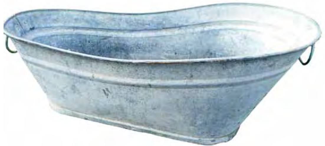
Relikt aus Notzeiten: Die Zinkbadewanne – auch für eine Doppelbelegung geeignet

vor dem Herd. Der Höhepunkt des Ganzen war dann der heiße Becher mit heißem Kakao, den es vor dem Zubettgehen gab. Jetzt konnte der Sonntag kommen.