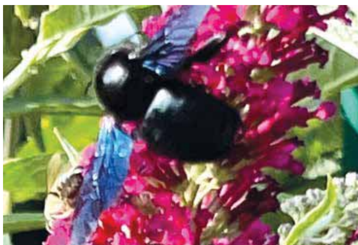
Die Blauschwarze Holzbiene ist die Wildbiene des Jahres 2024

Vielen Dank für Ihre Zuschrift! Da berichten Sie von einer sehr schönen Beobachtung eines beeindruckenden „dicken Brummers“. Die Holzbiene scheint sich bei uns immer wohler zu fühlen. Obwohl sie aus süd-