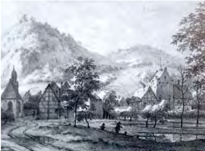
Ansicht der ursprünglichen Ritterburg | Fundstelle Haus im Turm/Kerckhoff

historische Herzogtum Berg das Sagen im Siebengebirge. Ihr Verwaltungssitz lag auf der Löwenburg. Als 1555 das Römische Recht im Herzogtum Berg eingeführt wurde, musste fürs Honnefer Hauptgericht ein professioneller Richter her. Hier fanden Zivil- und Strafprozesse statt. Als Gefängnis diente das Hontes, das Honnefer Gemeindehaus am Markt, und als Hinrichtungsstätte die Richtstätte Lohfeld. Weil der Weg von der Löwenburg nicht zumutbar war, logierte der Richter im nun „Haus im Turm“ genannten Gebäude. Auch die „Rentmeister“ genannten Finanzbeamten wohnten hier standesgemäß. Der Burg hinzugefügt wurden damals eine Kelterei mit Gewölbekellern, eine Brauerei, eine Bäckerei und ein Park.