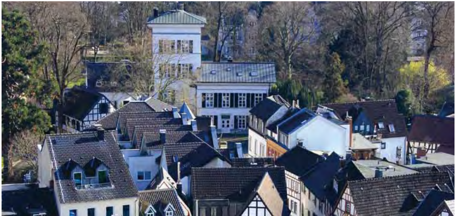
Blick aus den Rhöndorfer Weinbergen auf das Haus im Turm

fasst in rotem Sandstein. Doch Gattin Katharina Englert wollte mehr und vor allem wollte sie es moderner. In einer Umbauzeit von 1830 bis 1832 wurde dem Haus im Turm sein heutiger klassizistischer Stempel aufgedrückt. Die angeschlagenen Flügelbauten wurden durch neue Anbauten ersetzt. Am Ostflügel fügte man ein Wirtschaftsgebäude hinzu und zur Gartenseite hin entstand ein Wintergarten. Das Turmgiebelgeschoss wurde in einen Turm mit Dachhaube und aufgesetztem „Belvedere“ für die schöne Aussicht umgewandelt. Die Umbauten führten