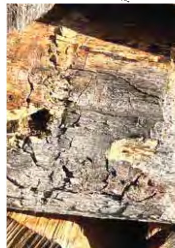
Einflugloch der Holzbiene

lichen Gefilden stammt, ist sie überraschend früh im Jahr aktiv. Ein Porträt des Insekts steht tatsächlich schon seit längerem auf der Themenliste für den rheinkiesel. Auch Ihre Beobachtung des Einfluglochs ist