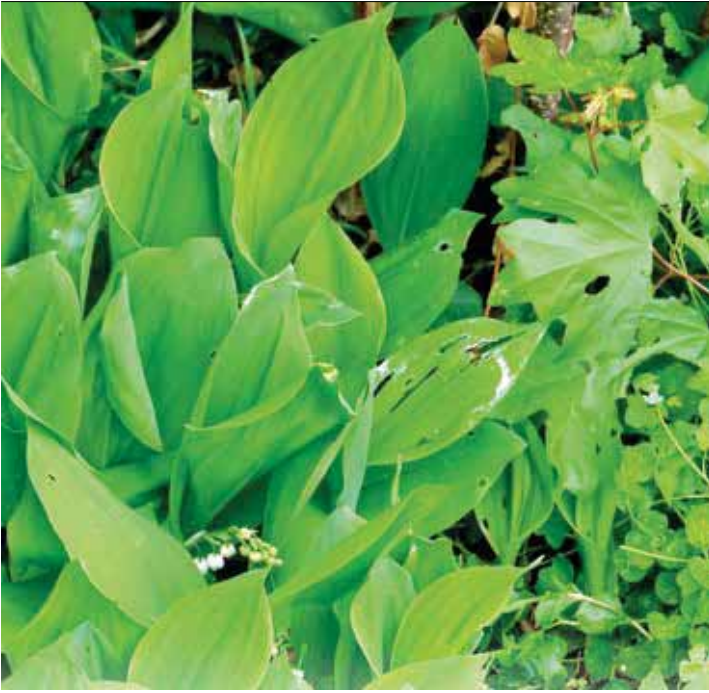
Maiglöckchenbestand im Laubwald | Bilder: Ulrich Sander

gründige Ähnlichkeit besteht in den langen, saftig-grünen Blättern mit einer parallelen Blattnervatur. Beide Arten bevorzugen nährstoff- und humusreiche, frische Wald- und Aueböden und beide bilden „Teppiche“ am Boden.