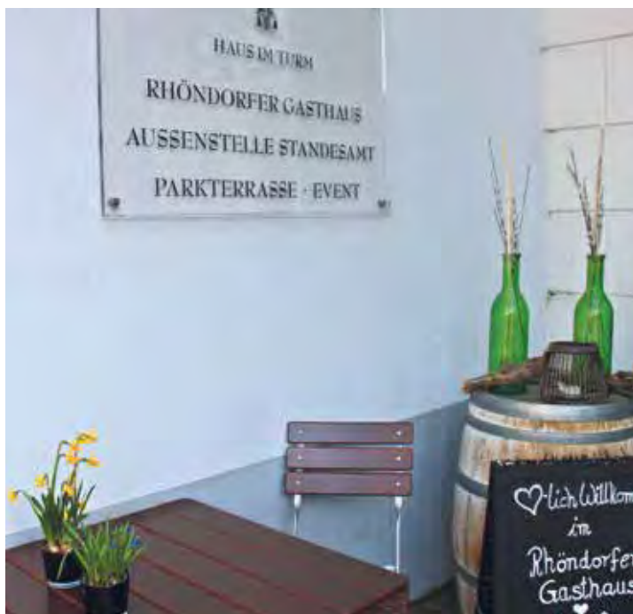
Gasthaus und Außenstelle des Standesamts

Landvolkshochschule auf dem Nachbargrundstück, der ehemaligen „Kemenate“.