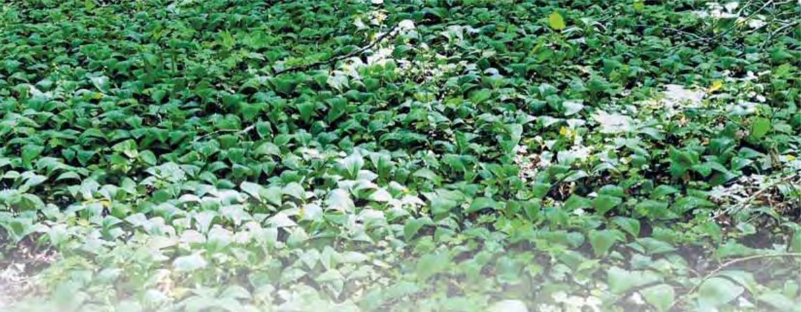
Bärlauchbestand im Laubwald