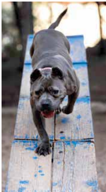
Motorische Übungen