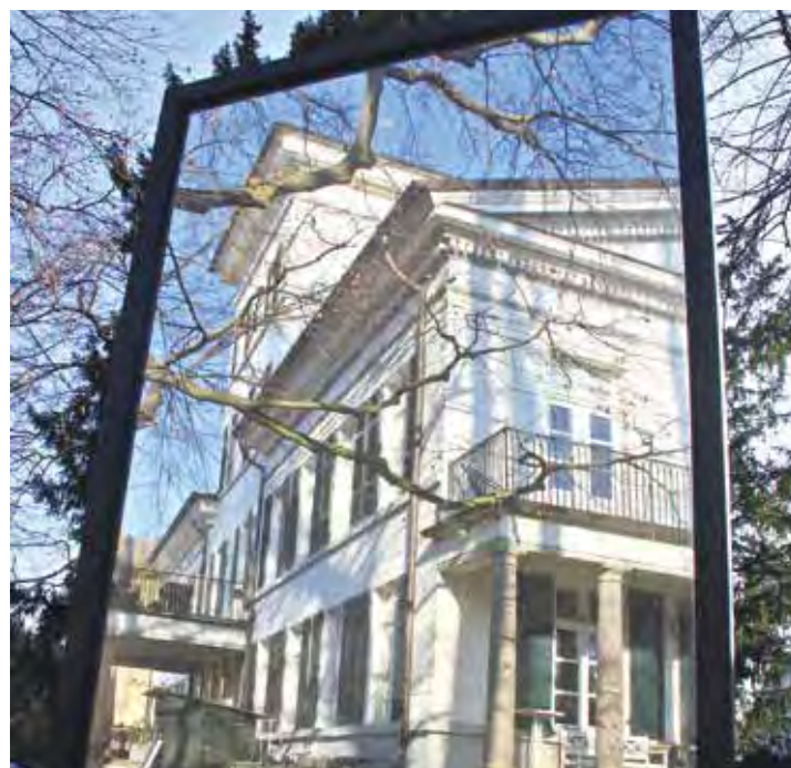
Haus im Turm mit Kunstinstallation

Diese unruhige Zeit wechselnder Besitzer, Nutzer und Verwalter ist der Villa Merkens anzusehen. Wirkt sie aus der Parkansicht herrschaftlich und aus einem Guss, muss man sich in der Vorderansicht erst zurechtfinden. Will man im Bild des Bauklötzchenturms bleiben, wurden vielleicht zu schnell und zu oft