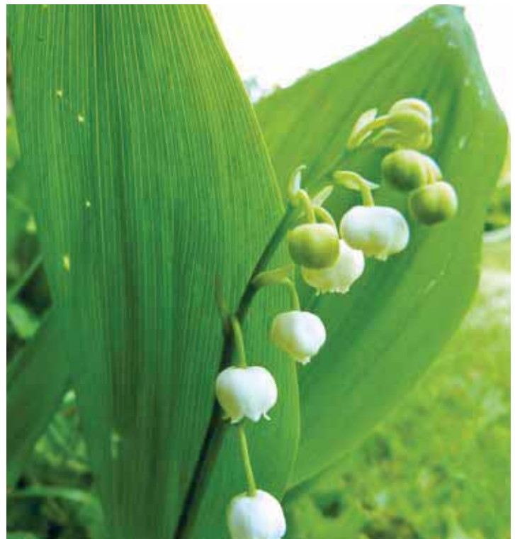
Maiglöckchen mit Blütenstand

Den Bärlauch zunächst wa- schen und trocken tupfen, ge- gebenenfalls grob schneiden. Dann mit den übrigen Zutaten unter Zugabe von Öl pürieren und am Ende mit Salz und Pfeffer abschmecken. Kühl für wenige Tage aufbewahren.