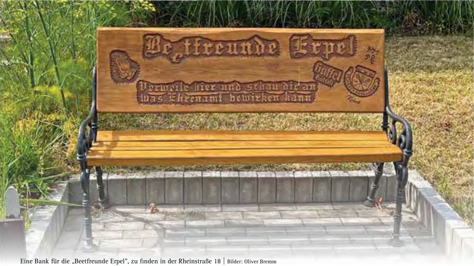
Eine Bank für die „Beetfreunde Erpel“, zu finden in der Rheinstraße 18 | Bilder: Oliver Bremm