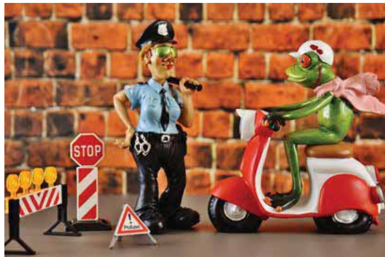
Darf ich mal den Führerschein sehen?

Ob sichergestellt oder beschlagnahmt: Polizei oder Staatsanwaltschaft müssen