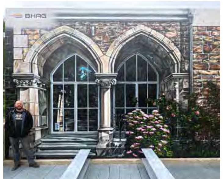
Eugen Schramm vor der Netzübernahmestation Rheinbreitbach

Fortschritturse - Aufbaukurse - Tanzkreise - Linedance