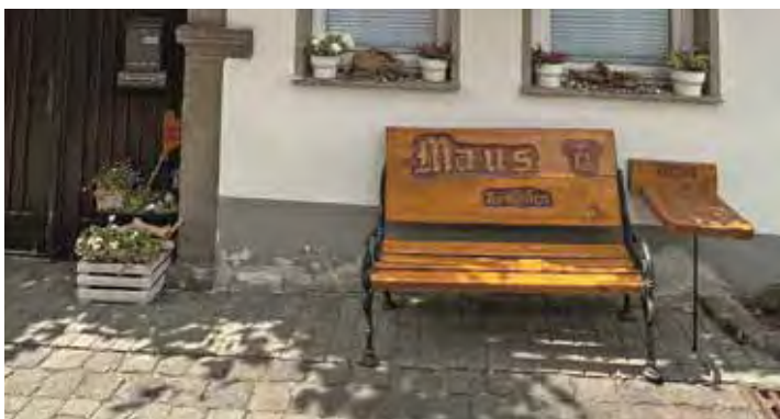
Vor dem alten Fachwerkhhaus aus dem Jahr 1751 steht das „Maus Bänkchen“

Web: www.bkm-bonn-koenigswinter.de Mail: chengels@bkm-mannesmann.de Direkt anrufen: 0 22 44 / 875 63 20 oder 0170 / 54 44 796