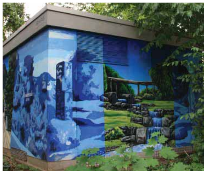
Die Wasserkaskade im Reitersdorfer Park (siehe Titelbild)

Deshalb drehen sich viele seiner Motive in Bad Honnef rund um das Thema Grundversorgung: Hier blubbert Wasser, dort flammt ein Blitz auf, an anderer Stelle schweben schwerelose Gasblasen. Viele Motive setzen erneuerbare Energien in Szene: Auf der Linzer Straße in Bad