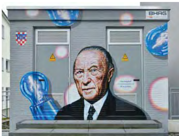
Der Altkanzler Konrad Adenauer prangt auf diesem Werk

Bad Honnef AG (BHAG). Das kommunale Energieversorgungsunternehmen ist 1948 aus dem Zusammenschluss der „Stadtwerke Bad Honnef“ und der „Städtischen Kurverwaltung“ hervorgegangen. Es versorgt Bad Honnef und Umgebung mit Strom, Trinkwasser und Erdgas.