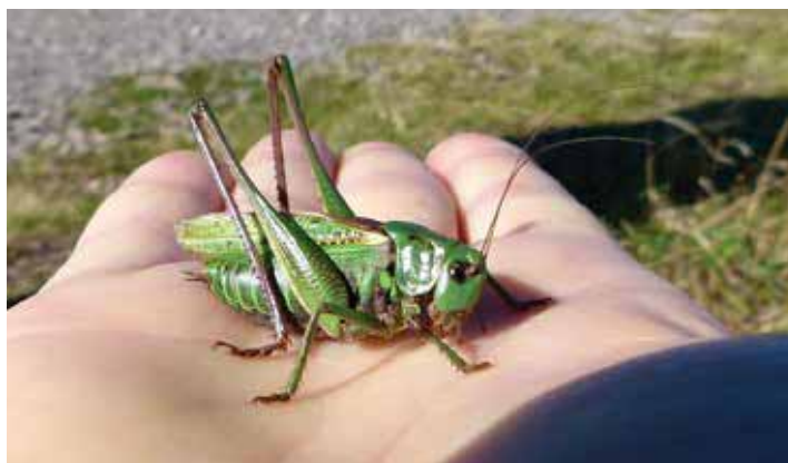
Nur für Mutige: Ein Warzenbeißer auf der Hand

In Sachen Anpassungsfähigkeit und Häufigkeit ist das Grüne Heupferd, auch Großes Heupferd genannt ( Tettigonia viridissima ), dem Warzenbeißer um Längen voraus. Wir finden es in fast jedem Winkel unseres Landes. Das Heupferd begnügt