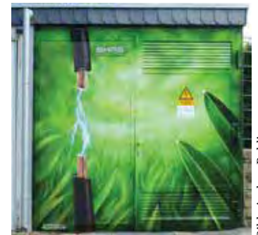
Mit Power: Strom-Graffiti

Neuester Tummelplatz des Graffiti-künstlers ist die Netzübernahmestation Rheinbreitbach nahe der Privatschule Schloss Hagerhof. Für die Fertigstellung der beiden monumentalen Flächen von acht bis zwölf Metern Breite und vier Metern Höhe veranschlagt Eugen Schramm je zwei bis drei Wochen. Dann wird das alte Schloss mit seiner großen Teichanlage dort energiesparend und ressourcenschonend seinen alten Glanz „versprühen“. ■