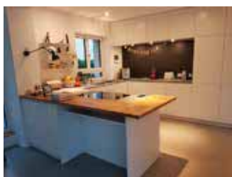
Einbauküchen & Innenausbau