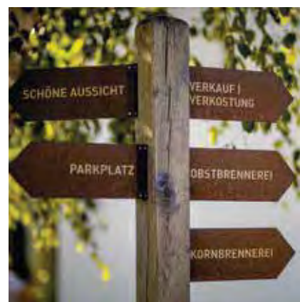
Auf dem Gelände der Brennerei

Allerdings muss man sich frühzeitig anmelden, denn die Veranstaltungen sind begehrt und zurzeit ausverkauft. Zudem gibt es die Möglichkeit, die Brennerei im Rahmen einer Führung zu besichtigen, um einen ersten Eindruck zu bekommen. ■