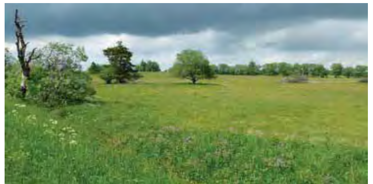
Auf solchen Wiesen lebt der Warzenbeißer