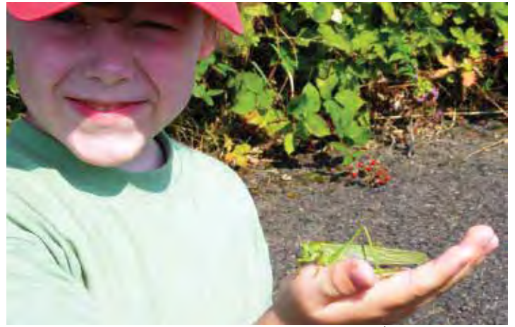
Grünes Heupferd auf der Hand

Inhaberin: Apothekerin Astrid Bott Königswinterer Str. 673 53227 Bonn Tel.: 0228/441 211 Fax: 0228/440 224 kreuz.apo.bonn@pharma-online.de www.kreuz-apotheke.biz