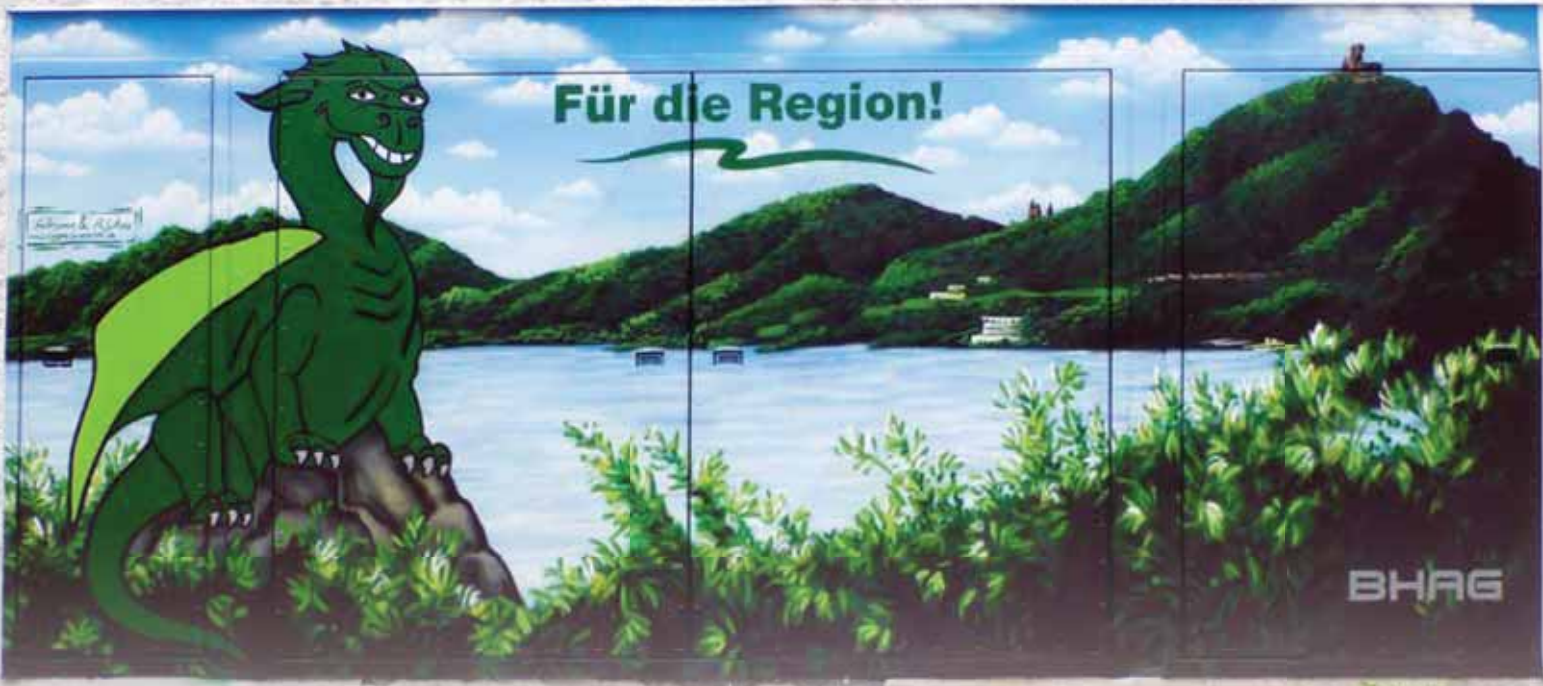
Einladend: Regionales Graffiti in der Bad Honnefer Kirchstraße