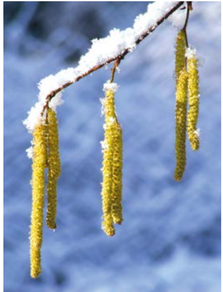
Haselnuss-Kätzchen im Schnee

Zarte Blüten, die sich bei manchen Kräutern oder Straucharten schon Anfang eines jeden Jahres, somit noch während des kalten Winters zeigen, sind durch pure Chemie geschützt. Es klingt fast wie ein Griff in die Medikamentenschublade, wenn man liest, welche Wundermittel zu den bemerkenswerten Gefrierpunkt-Herabsenkungen führen können. Zum Bio-Frostschutz gehören beispielsweise Eiweiß-Bausteine, Zucker, zuckerähnliche Verbindungen, Sorbit oder Glycerin. Im Zellsaft der Pflanze verhindern diese Stoffe bei Temperaturen unter dem Gefrierpunkt, dass sich kleine Eiskristalle bilden. Denn