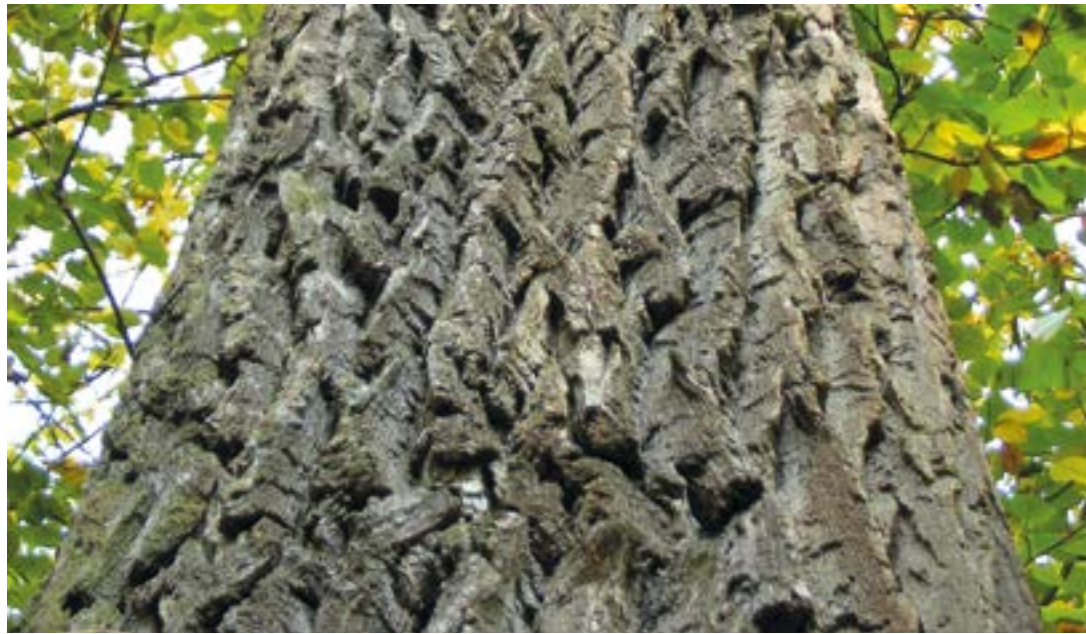
Wärmeschutz einmal anders: Dicke Borke einer alten Eiche

Der alljährliche Laubfall bei uns, aber auch in den gesamten gemäßigten Breiten auf der Nordhalbkugel, dient der Vermeidung von Frostschäden der empfindlichen Blattoorgane. Dieses weltumspannende Phä-