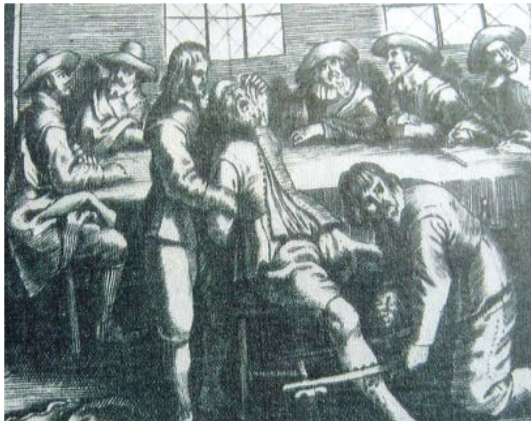
Eine der schmerzhaftesten Foltermethoden: Die Beinpresse