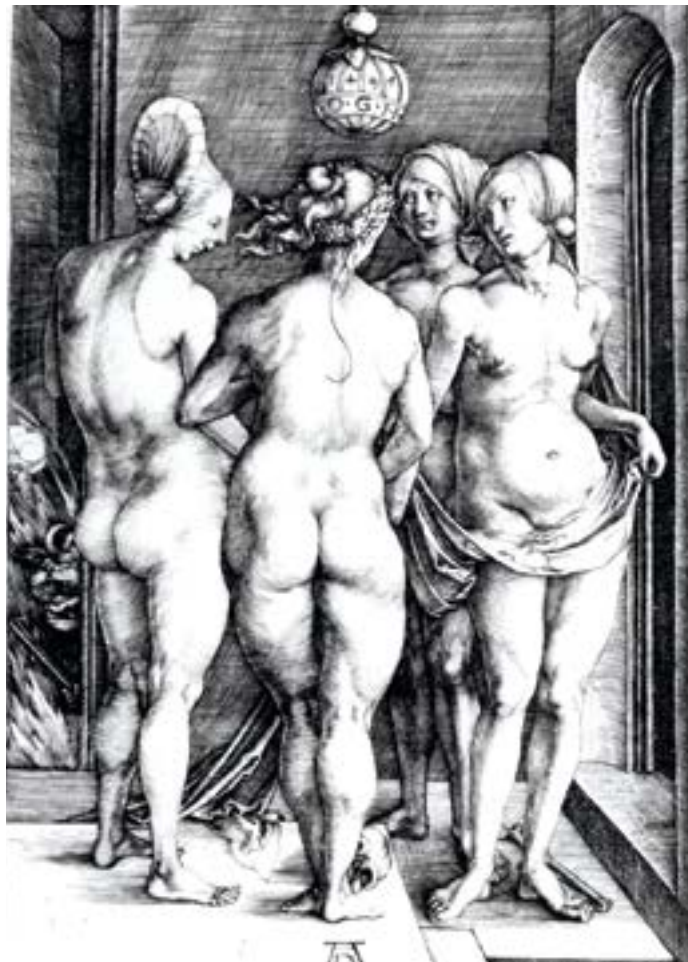
„Die vier Hexen“ von Albrecht Dürer (ca. 1491)

Am Nachmittag wurden die Beschuldigten gefesselt und an einem Seil, das an der Decke