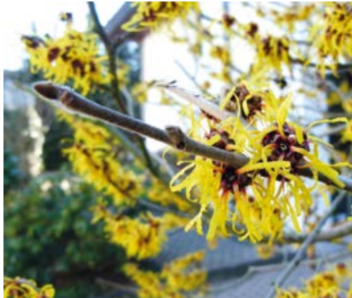
Blühende Zaubernuss

Doch selbst der vermeintliche Abfall, das ganze Falllaub mit beträchtlicher organischer Masse, ist in der Natur nicht wertlos. Für zahllose Organismen dient die Laubschicht am Boden als Lebensraum, Versteck oder Nahrung – und wird nach der Verrottung schließlich zum wertvollen Humus, der Spurenelemente, Mineralien und Nährstoffe für alle Pflanzen liefert. Und man höre und staune: Die Laubschicht am Boden schützt auch vor Bodenfrost!