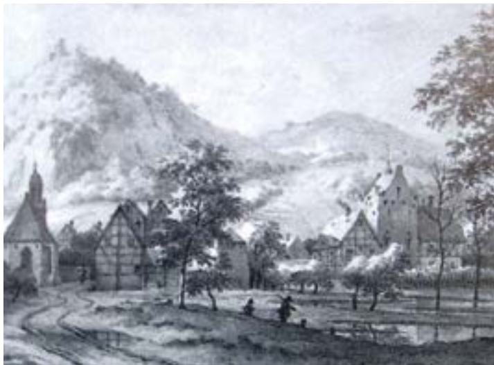
Ansicht der ursprünglichen Ritterburg