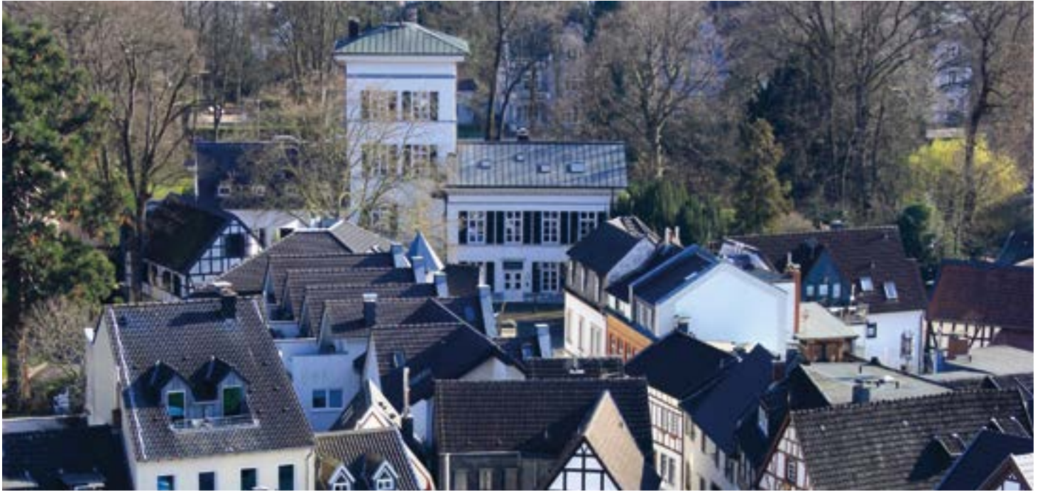
Blick aus den Rhöndorfer Weinbergen auf das Haus im Turm

fasst in rotem Sandstein. Doch Gattin Katharina Englert wollte mehr und vor allem wollte sie es moderner. In einer Umbauzeit von 1830 bis 1832 wurde dem Haus im Turm sein heutiger klassizistischer Stempel aufgedrückt. Die angeschlagenen Flügelbauten wurden durch neue Anbauten ersetzt. Am Ostflügel fügte man ein Wirtschaftsgebäude hinzu und zur Gartenseite hin entstand ein Wintergarten. Das Turmgiebelgeschoss wurde in einen Turm mit Dachhaube und aufgesetztem „Belvedere“ für die schöne Aussicht umgewandelt. Die Umbauten führten