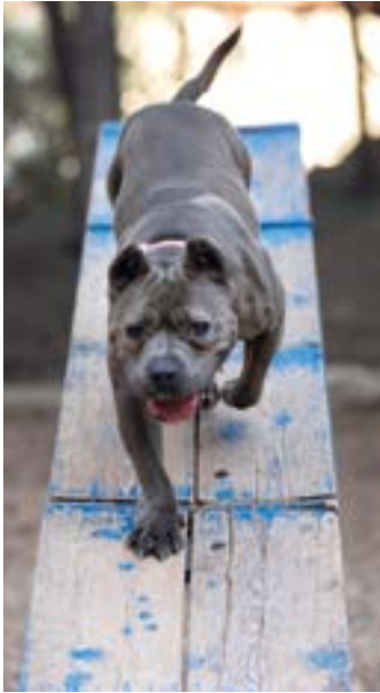
Motorische Übungen