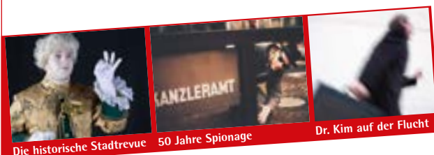
Die historische Stadtrevue