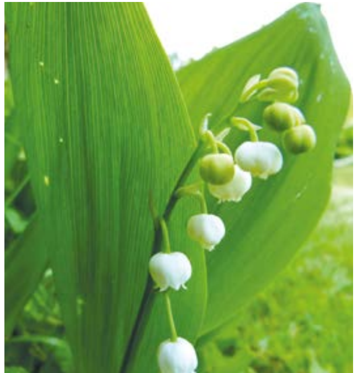
Maiglöckchen mit Blütenstand

Den Bärlauch zunächst wa- schen und trocken tupfen, ge- gebenenfalls grob schneiden. Dann mit den übrigen Zutaten unter Zugabe von Öl pürieren und am Ende mit Salz und Pfeffer abschmecken. Kühl für wenige Tage aufbewahren.