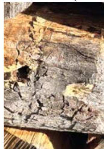
Einflugloch der Holzbiene

lichen Gefilden stammt, ist sie überraschend früh im Jahr aktiv. Ein Porträt des Insekts steht tatsächlich schon seit längerem auf der Themenliste für den rheinkiesel. Auch Ihre Beobachtung des Einfluglochs ist