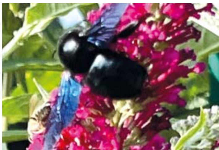
Die Blauschwarze Holzbiene ist die Wildbiene des Jahres 2024

Vielen Dank für Ihre Zuschrift! Da berichten Sie von einer sehr schönen Beobachtung eines beeindruckenden „dicken Brummers“. Die Holzbiene scheint sich bei uns immer wohler zu fühlen. Obwohl sie aus süd-