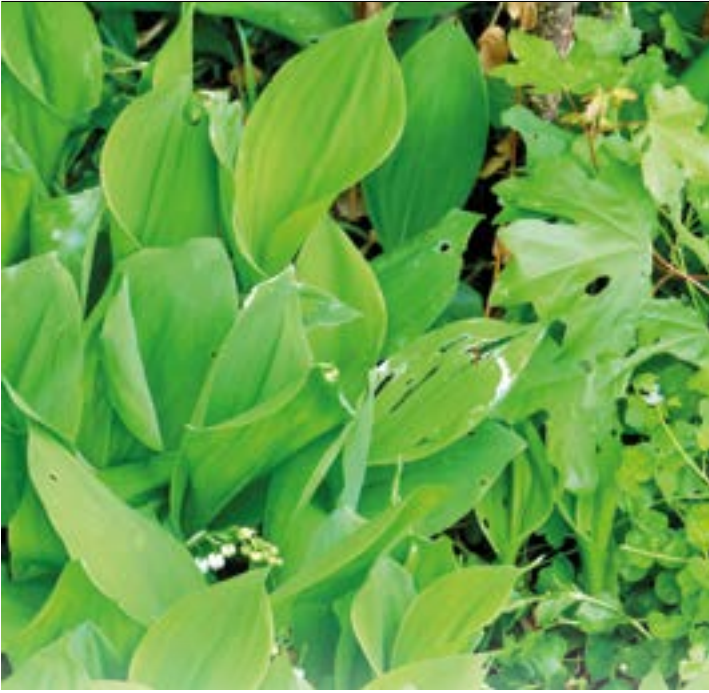
Maiglöckchenbestand im Laubwald

gründige Ähnlichkeit besteht in den langen, saftig-grünen Blättern mit einer parallelen Blattnervatur. Beide Arten bevorzugen nährstoff- und humusreiche, frische Wald- und Aueböden und beide bilden „Teppiche“ am Boden.