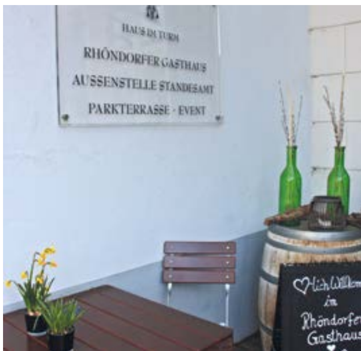
Gasthaus und Außenstelle des Standesamts

Landvolkshochschule auf dem Nachbargrundstück, der ehemaligen „Kemenate“.