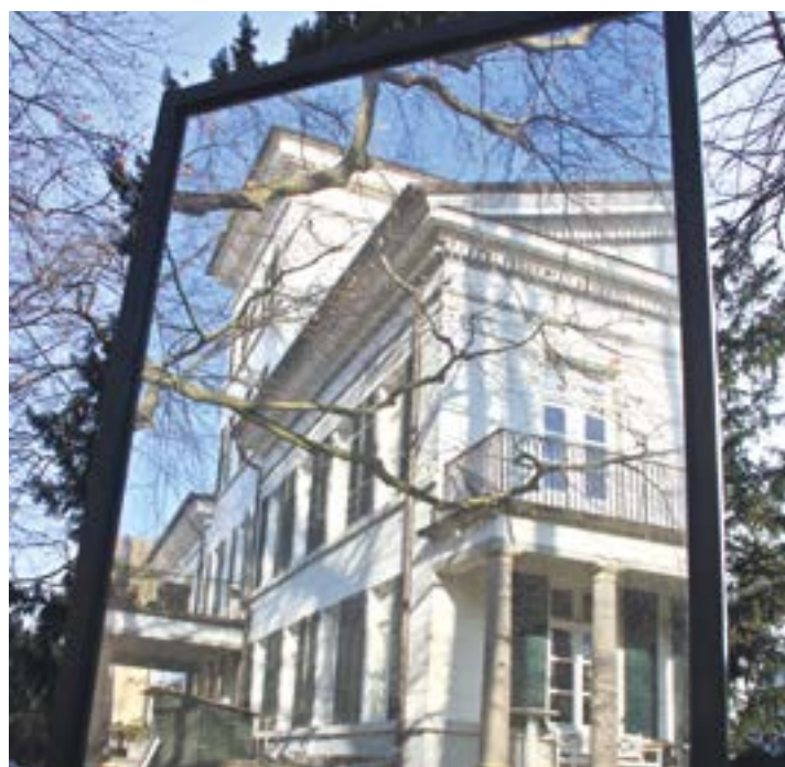
Haus im Turm mit Kunstinstallation

Diese unruhige Zeit wechselnder Besitzer, Nutzer und Verwalter ist der Villa Merkens anzusehen. Wirkt sie aus der Parkansicht herrschaftlich und aus einem Guss, muss man sich in der Vorderansicht erst zurechtfinden. Will man im Bild des Bauklötzchenturms bleiben, wurden vielleicht zu schnell und zu oft